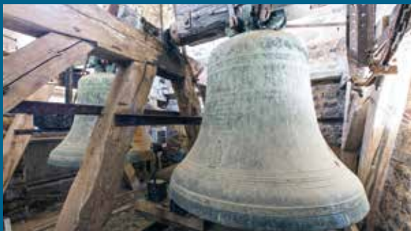
2. CLOCHE DE L'ÉGLISE DU HOUSSEAU